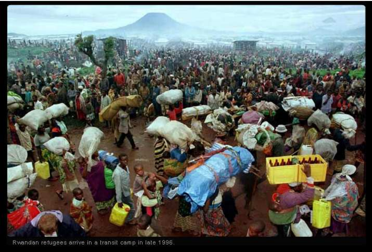
Rwandan refugees arrive in a transit camp in late 1996.