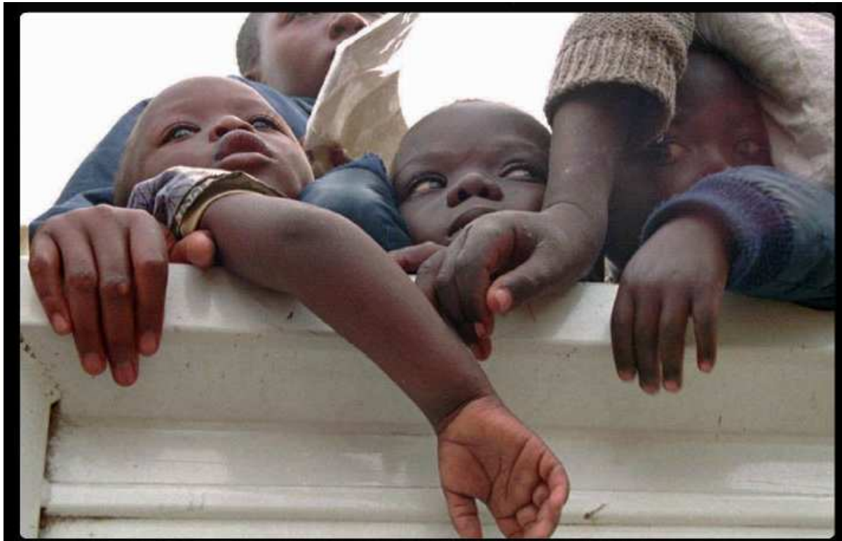
August 1995 - Rwandan orphans, arrive at a new orphanage in Goma, Zaire.